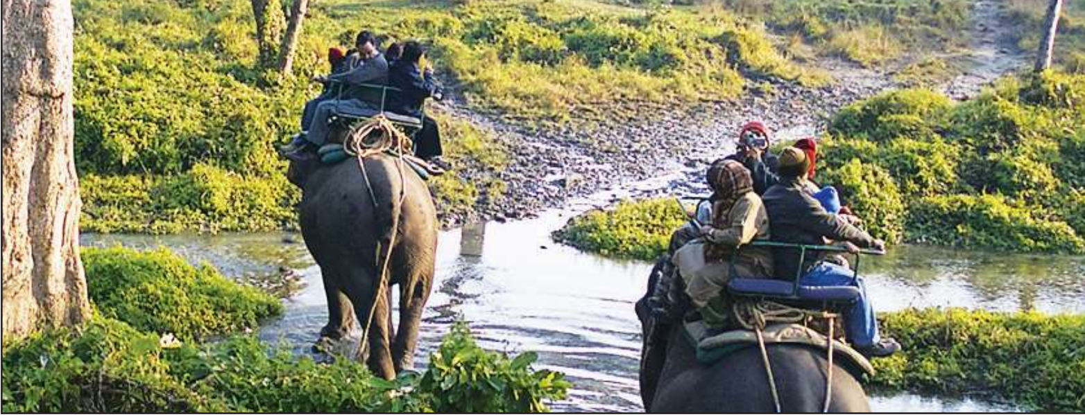
‘जंगल सफारी’सारख्या उपक्रमातून निसर्ग संवर्धनाला प्रोत्साहन मिळतेच आणि स्थानिक लोकांनाही रोजगार उपलब्ध होतो.