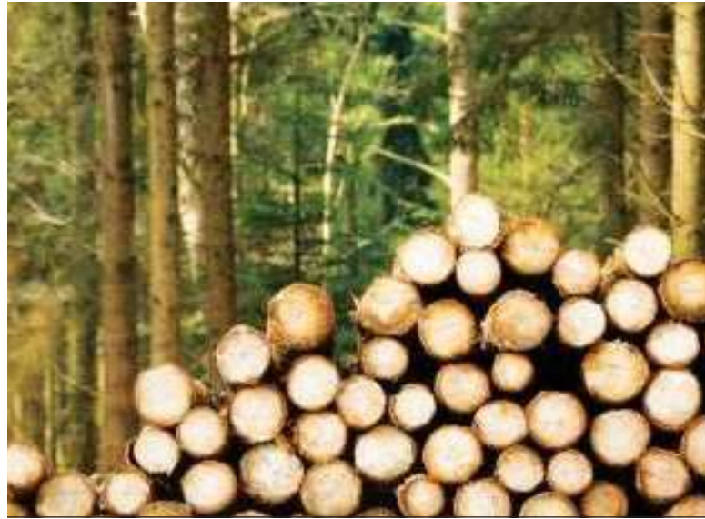
औद्योगिक क्रांतीच्या काळात मोठ्या प्रमाणात वनीकरण झाले ते लाकूड उत्पादनासाठी!